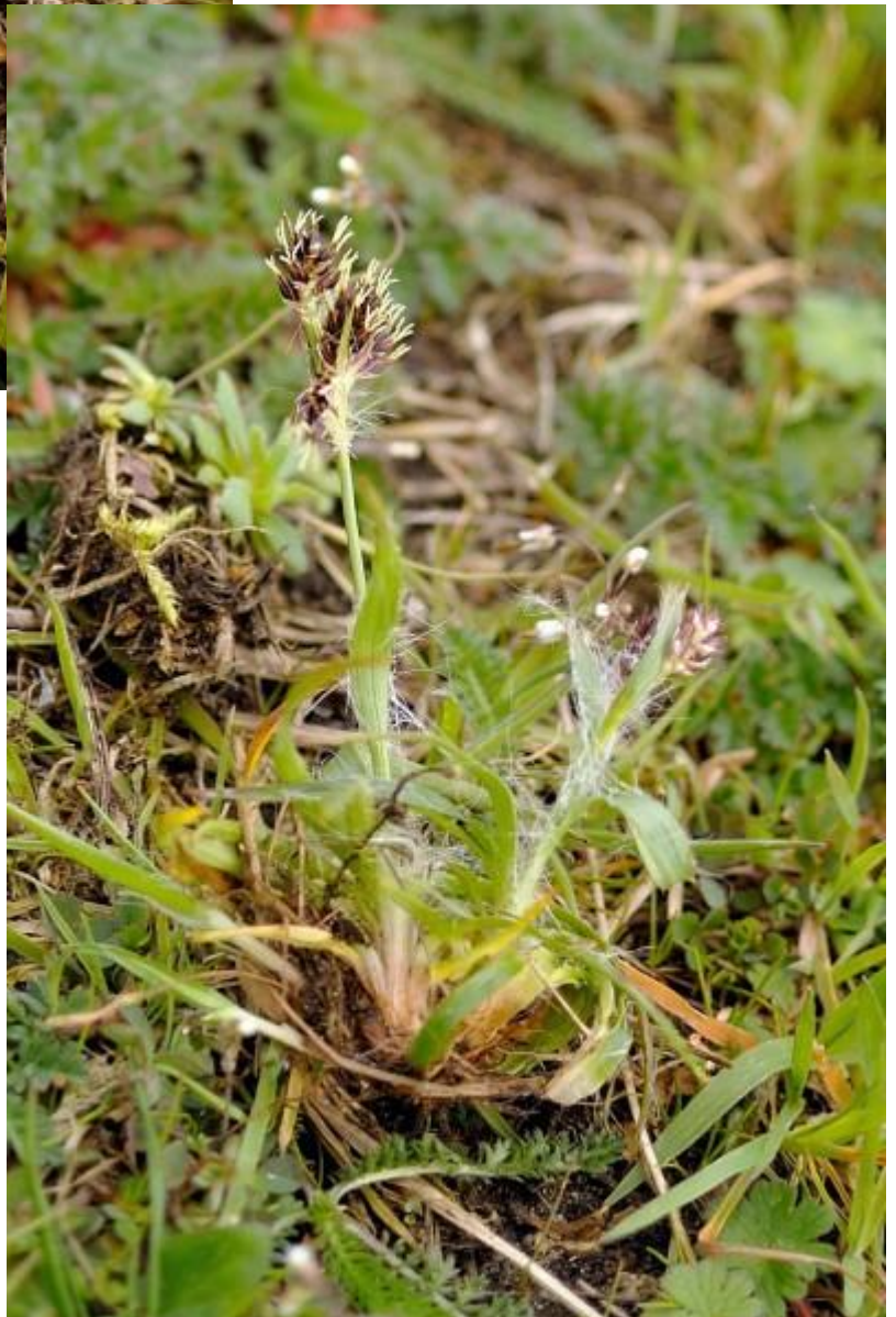
De veldbies doet niet voor hem onder