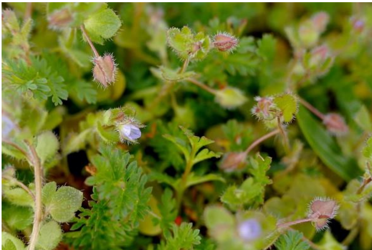
De klimopereprijs wordt net wakker