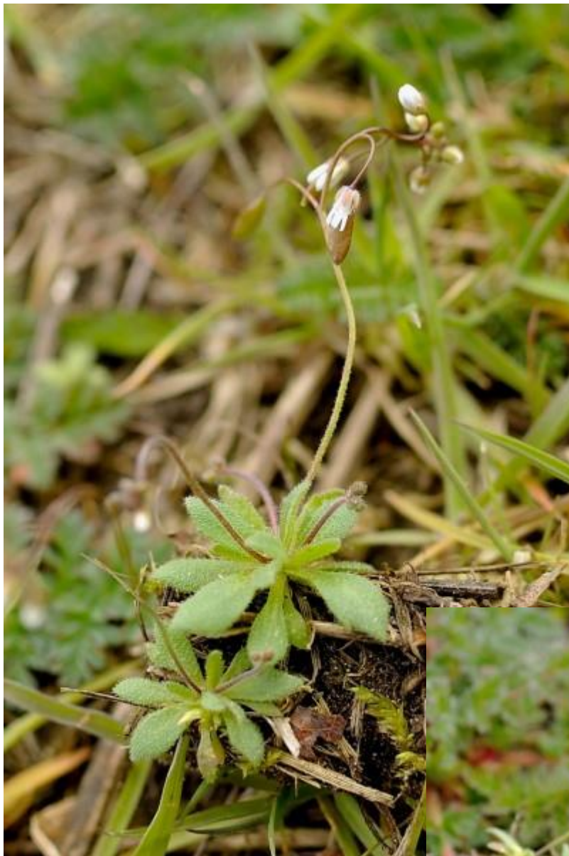
Die is er vroeg bij de vroegeling