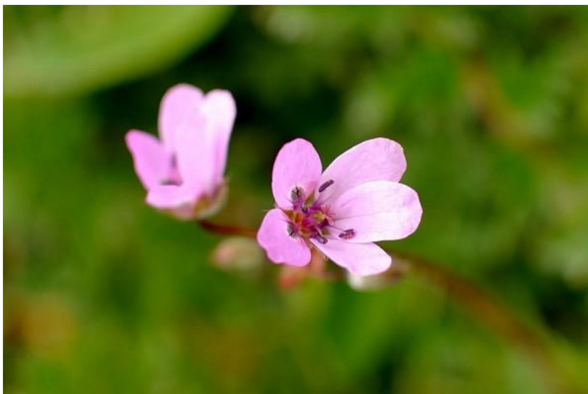
De gewone ooievaarsbek staat intussen al te pronken